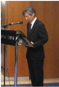
Allocution de SEM INOUE Susumu Ambassadeur du Japon