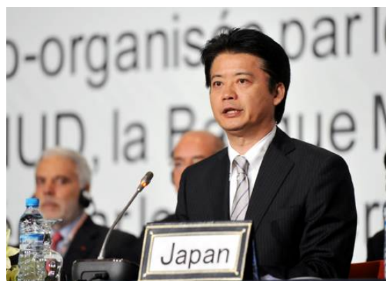
M. Koichiro GEMBA Ministre des Affaires Etrangères du Japon

M. GEMBA a d'ailleurs insisté, en ce qui concerne la TICAD V qui aura lieu à Yokohama au Japon en juin 2013, sur l'importance de la promotion de la croissance économique en Afrique et du développement résilient, inclusif et durable de la société. Ensuite, lors de la plénière portant sur la croissance économique actuelle et les défis sous-jacents en Afrique, les participants ont reconnu le rôle principal du secteur privé dans le développement économique en Afrique. Ils ont également insisté sur l'importance capitale du secteur agricole pour la réalisation de la sécurité alimentaire dans ce continent. Enfin, dans la plénière sur le changement climatique, les participants ont pris note du rapport intermédiaire sur la formulation d'une « Stratégie de croissance verte pour l'Afrique ». A cet égard, ils se sont engagés à renforcer la synergie avec les initiatives et les processus en cours en Afrique sous l'égide des organisations régionales comme l'UA et la BAD.