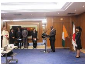
Allocution de SEM Kablan DUNCAN Ministre d'Etat, Ministre des Affaires Etrangères de Côte d'Ivoire