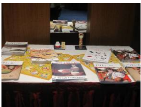
Cadeaux pour les invités

Le 14 mars 2012 à l'hôtel Tiama a eu lieu la commémoration à Abidjan, du premier anniversaire du grand séisme de l'Est du Japon. A cette occasion, l'Ambassadeur du Japon, SEM INOUE Susumu a livré 3 grands messages devant de nombreuses personnalités ivoiriennes et diplomatiques invitées à ladite cérémonie :