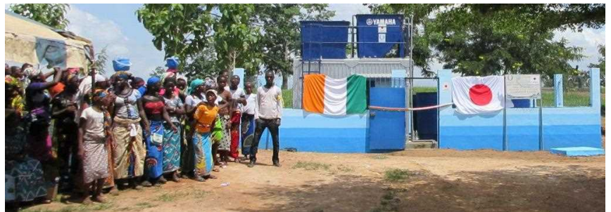
Les populations de N'Zianouan heureuses de recevoir le système de purification d'eau

L'Ambassadeur du Japon a remis le jeudi 02 juin 2016 des infrastructures du « Projet d'Installation du Système d'Approvisionnement en eau potable de N'Zianouan, dans le Département de Tiassalé », aux populations de cette localité, en présence des Autorités administratives et coutumières. Ce projet financé par le Gouvernement du Japon à hauteur 56 millions de francs CFA se situe dans le cadre des dons aux micro-projets locaux contribuant à la sécurité humaine. Il a été réalisé grâce à la technologie dite « Clean Water System » de la société japonaise YAMAHA. Ce système ingénieux, écologique et d'entretien facile qui a déjà donné de très bons résultats dans plusieurs régions défavorisées, consiste au pompage, à la désalinisation et à la purification de l'eau du fleuve jouxtant le village. D'une capacité de 8000 litres par jour, cette infrastructure hydraulique de pointe permettra de soulager les populations du village de longues et pénibles corvées d'eau.