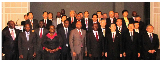
La délégation japonaise avec le Premier ministre et plusieurs ministres ivoiriens en charge des infrastructures, des Transports, de la Construction

Dans le cadre de la TICAD VI, une Conférence des Secteurs Public et Privé sur les Infrastructures de Pointe a été organisée le 3 mai 2016 à Abidjan, en présence du Premier ministre ivoirien M. Daniel Kablan DUNCAN et du Ministre adjoint de l'Aménagement du Territoire, des Infrastructures, des Transports et du Tourisme du Japon,