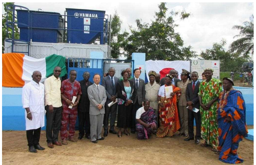
Les bénéficiaires avec les Autorités coutumières et administratives, les responsables de Yamaha et l'Ambassadeur du Japon