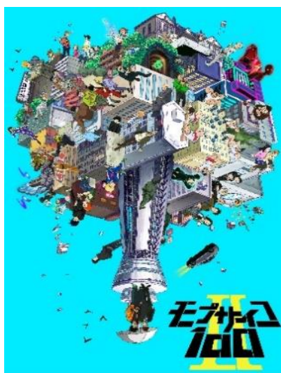
Mob Psycho 100 II