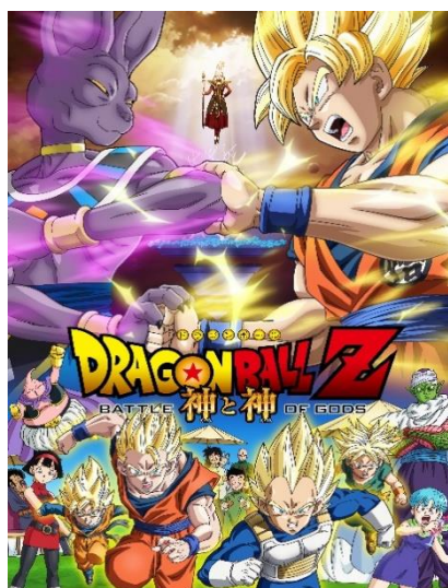
Dragon Ball Z :