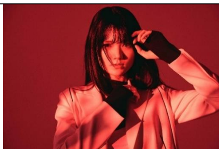
sajou no hana

DRAGON BALL Z the Movie Production Committee